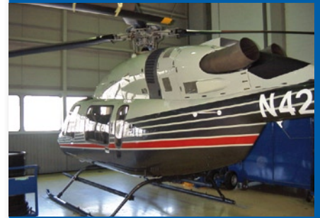
Lackierung und Beschriftung nach Maß

Langfristige Kundenzufriedenheit, Weiterempfehlung und eine kontinuierliche Weiterentwicklung unserer Qualitätsstandards sind für uns die Messlatte unseres Unternehmenserfolgs.