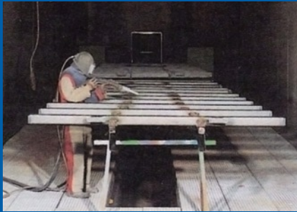
Die Strahlung variiert je nach Material und Beschaffenheit