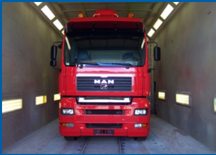
Unsere Großteilanlage eignet sich ideal für großformatige Bearbeitung