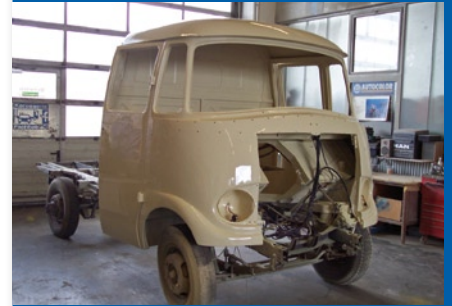
Lackierarbeiten mit Liebe zum Detail