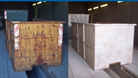
Optimale Reinigung sorgt für beste Lackierergebnisse (links vorher, rechts nach Reinigung)